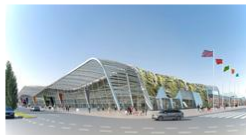
Bureau d'Architecture McAdam Architects-Londre

Sa mise en chantier a commencé à l'automne 2012, les équipements seront livrés début 2015.