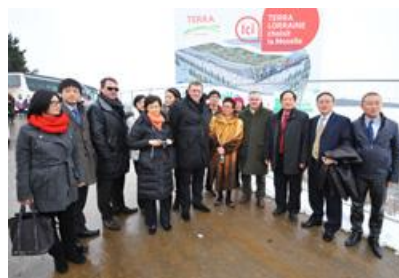
Des représentants d'entreprise de la ville de Canton (3e plus grande ville de Chine après Shanghai et Pékin) et de la région de Guangxi reçus en Moselle (12/2/2013)