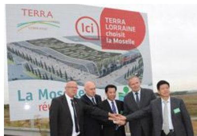
Signature de la Convention de Partenariat (21/9/2012)

Le Conseil Départemental et TerraLorraine s'engagent à favoriser les meilleures retombées économiques (activités, emplois...) pour le Département et la mise en oeuvre de tous les moyens (logistiques, humains,...) concourant à la réussite du projet