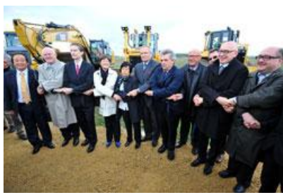
Début des travaux de terrassement (12/10/2012)