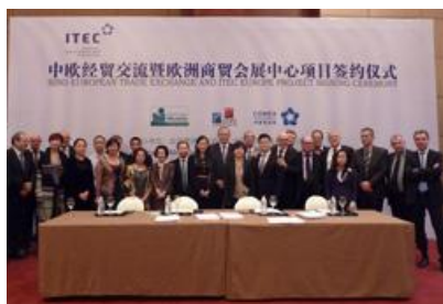
Une délégation, constituée d'élus du Conseil Départemental et de chefs d'entreprises mosellans en Chine (28/10/2012 - 2/11/2012) Préparation de la construction d'ITEC Chengdu (le premier ITEC chinois) qui donnera la possibilité aux entreprises européennes d'irriguer le marché du sud-ouest de la Chine dès le 2e semestre 2014.