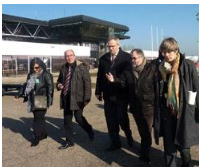
Perspectives d'aménagement de zones logistiques complémentaires sur l'aéroport Metz-Nancy-Lorraine (4/3/2013)