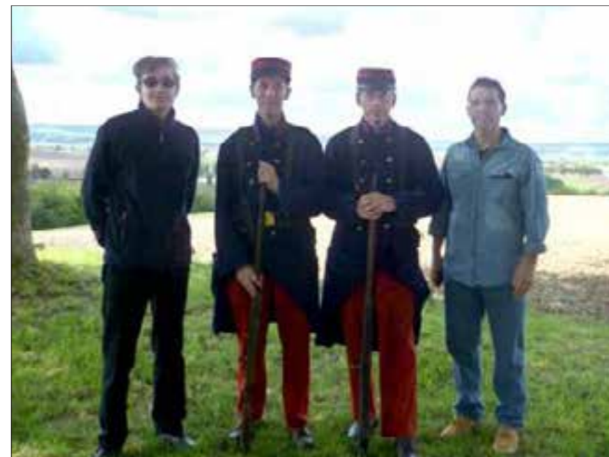
Les amis du Saulnois et du Patrimoine font venir ce dimanche à Château-Salins des hommes en uniformes, d'époque.