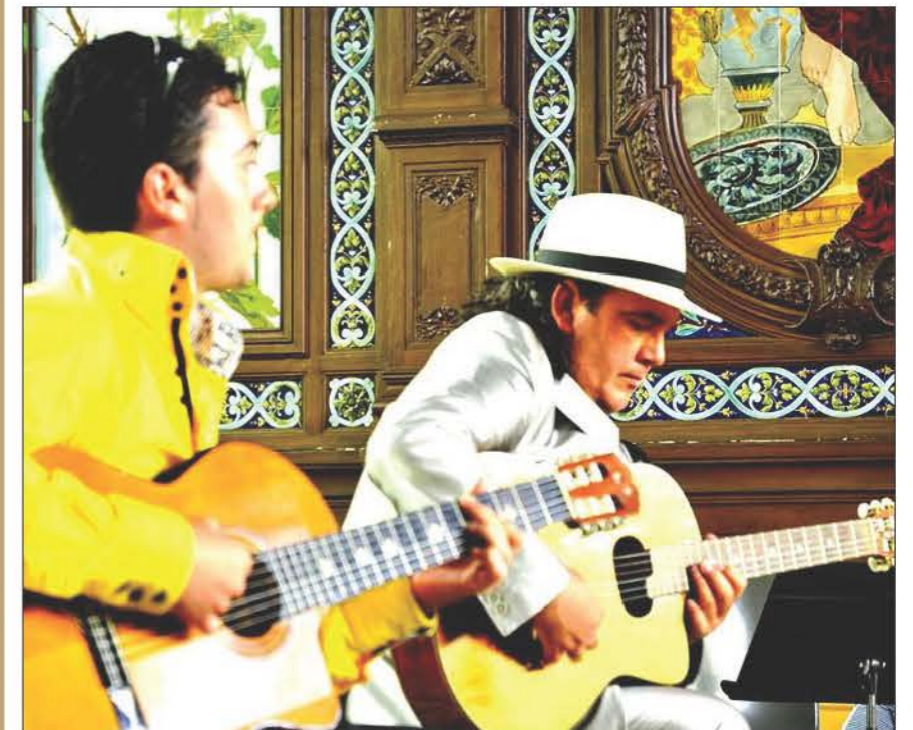
Le Trio Paquito Gipsy Mundo reprendra les standards du Jazz manouche.